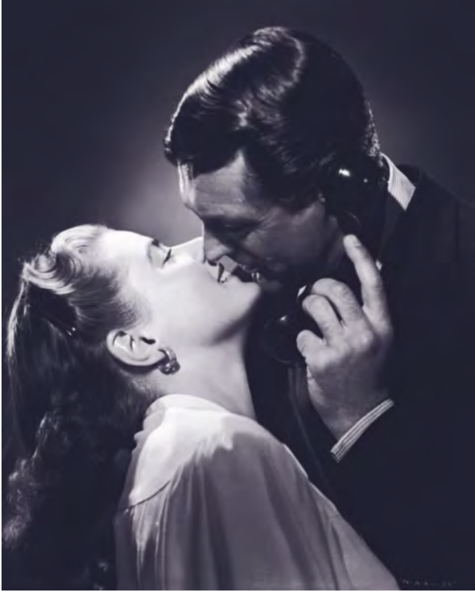
Cary Grant and Ingrid Bergman, Notorious, 1940