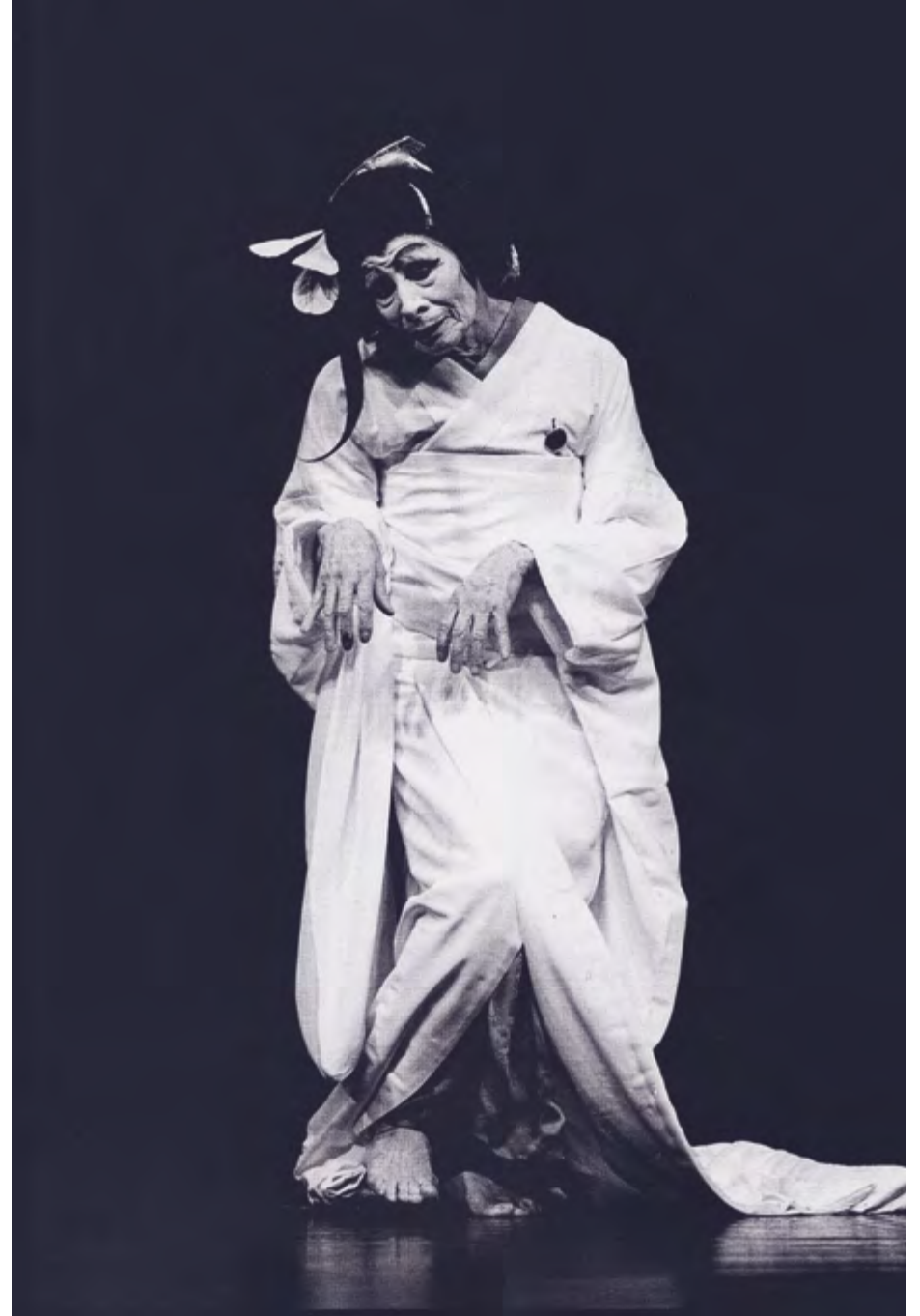
Kazuo Ohno, Water Lilies, 1987