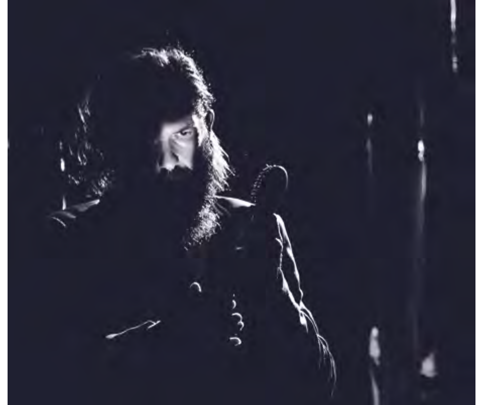
Un HOMME

Il évolue vers la régie générale notamment au sein des compagnies Belladonna, Ultima Necat et plus récemment Java Vérité.